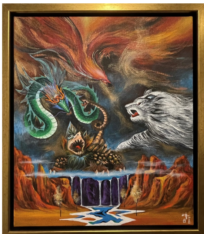
C-11 朱雀青龍白虎玄武，油彩壓克力，8F，2022