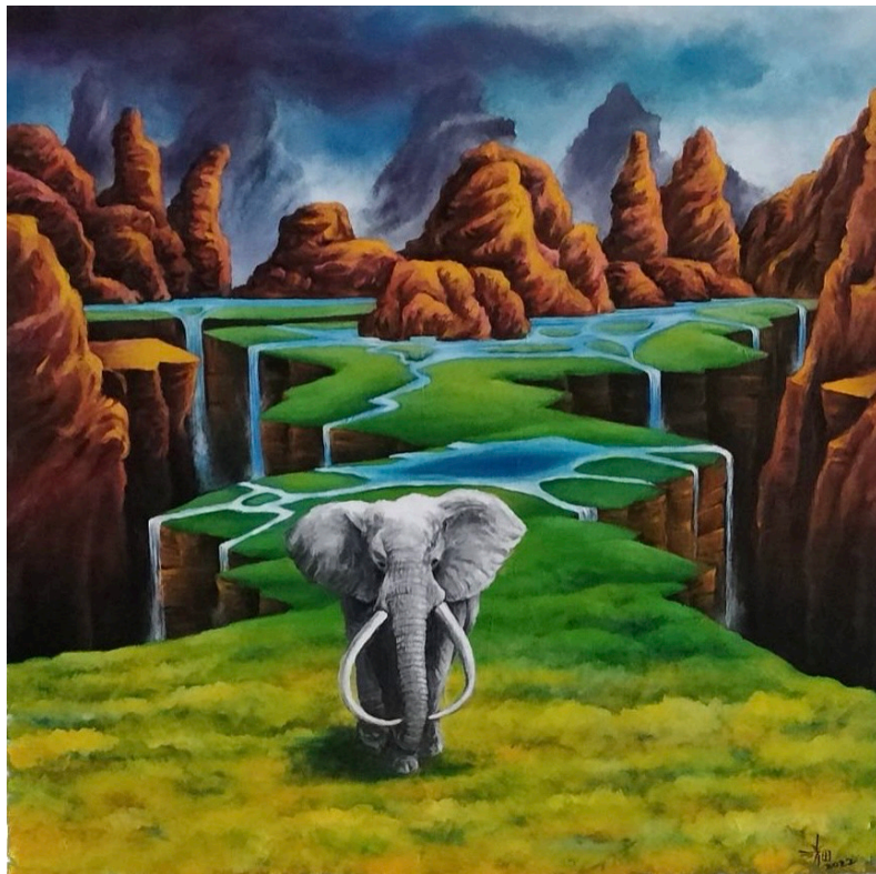
B-4 白象的祝福，油彩壓克力，80×80cm，2022