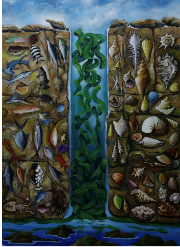
B-3 生命之養份，油彩壓克力，91×72cm，2020