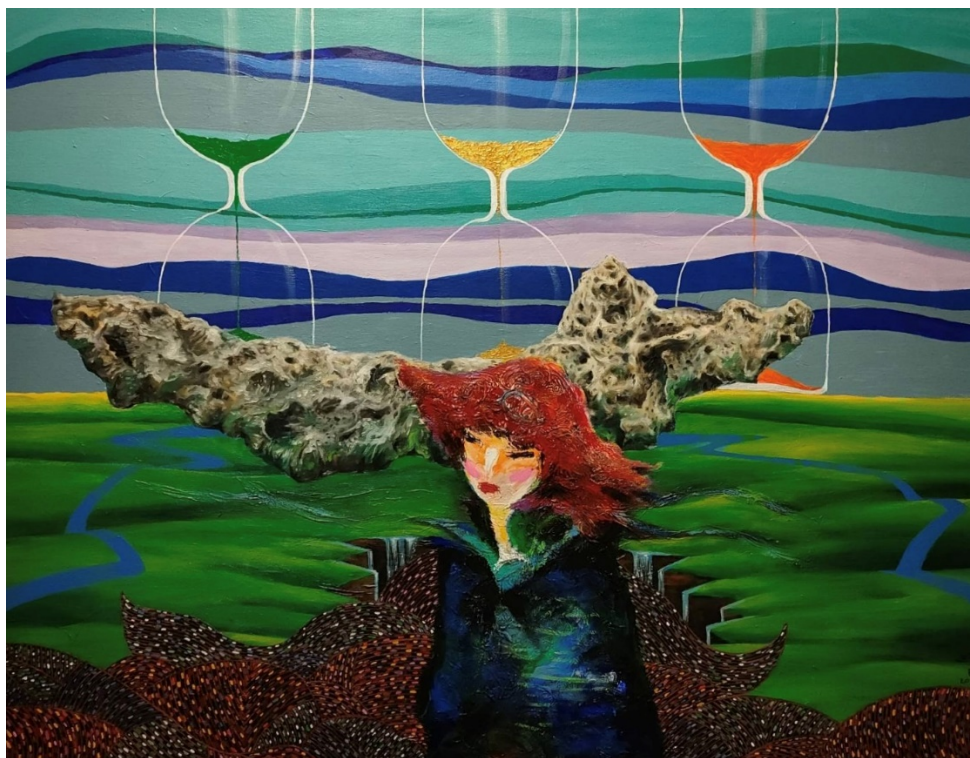
B-13 青春的歲月，油彩壓克力，50F，2023