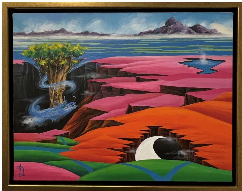
C-3 混沌生兩儀，油彩壓克力，8F，2022