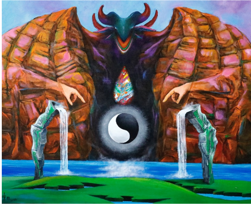
B-11 生命之泉，油彩壓克力，72.5×65cm，2022