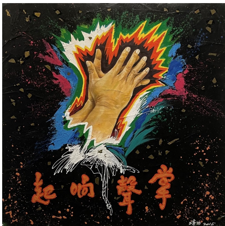
A-2 掌聲響起，壓克力複合媒材，60×60cm，2015