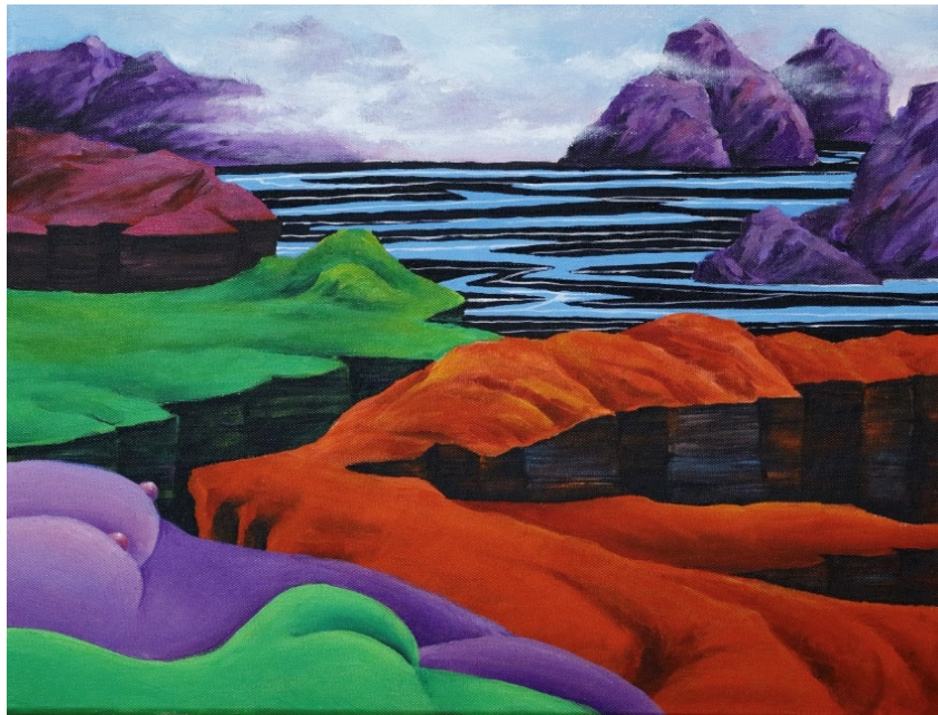
B-12 大地-萬物之母，油彩壓克力，6F，2022