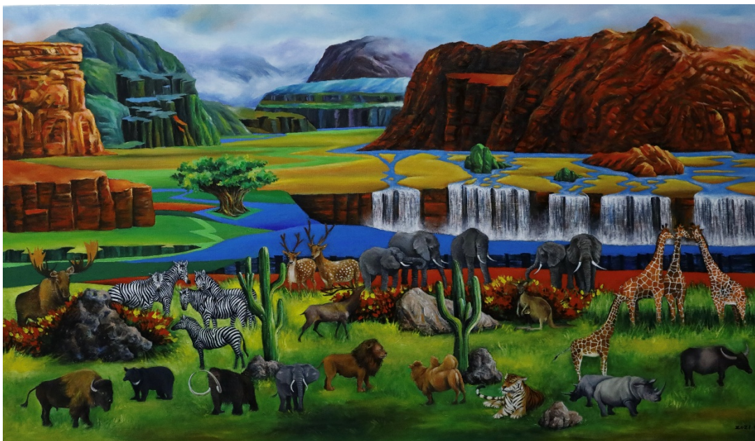
B-2 萬獸祥和，油彩壓克力，140×80cm，2021