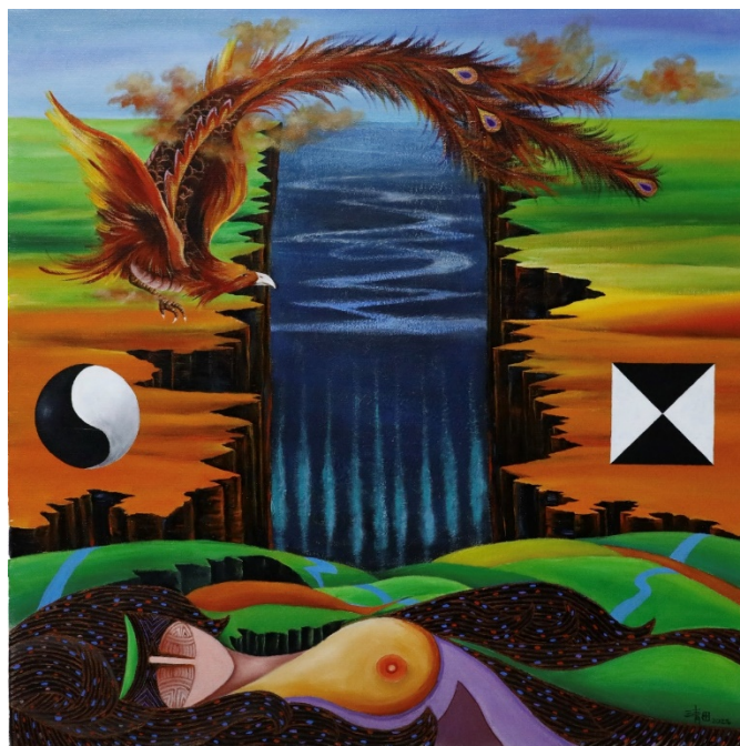
C-12 有鳳來儀，油彩壓克力，80×80cm，2021