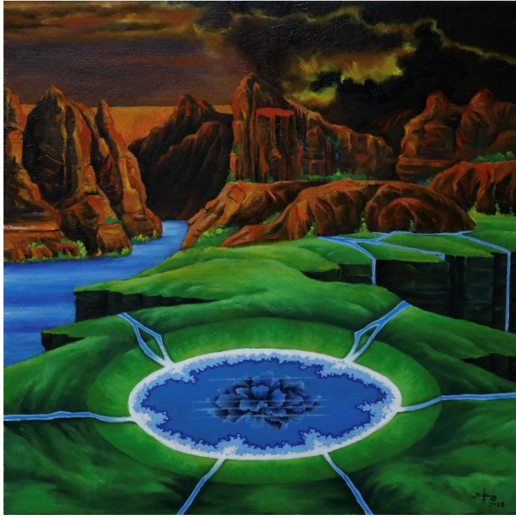
B-5 寧靜之湖，油彩壓克力，90×90cm，2020