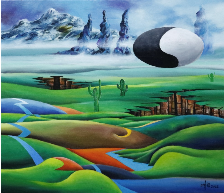
C-2 豐盈大地，油彩壓克力，60.5×50cm，2022