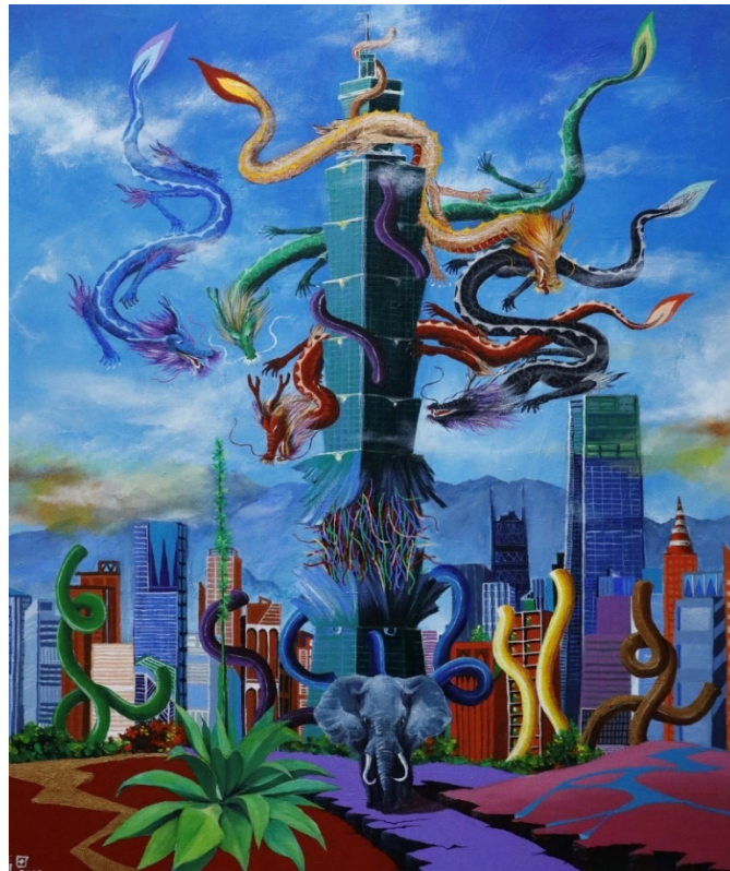
B-10 象山傳奇，油彩壓克力，80×65cm，2022