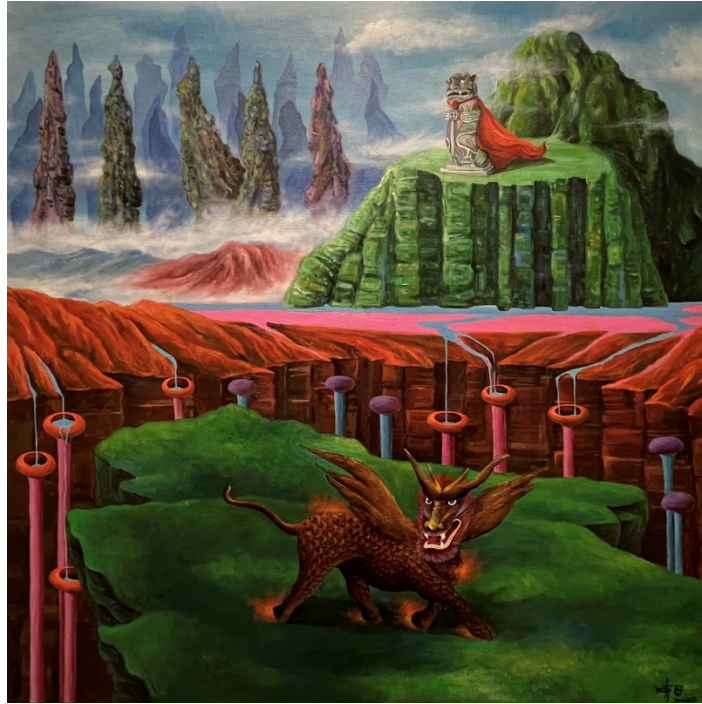
B-9 風獅與麒麟，油彩壓克力，80×80cm，2022